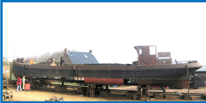
Cornelia op de werf 'De Vlijt' in Coevorden