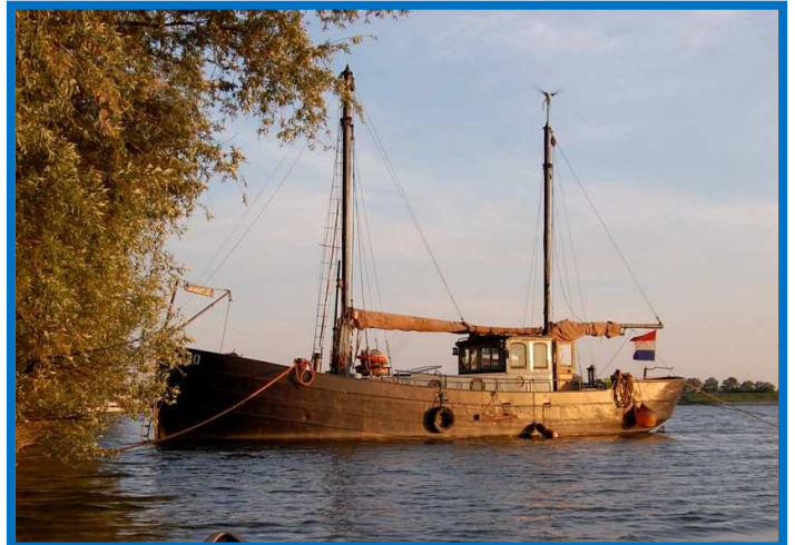
De Jannetje in haar huidige vorm als kunstschilderschip