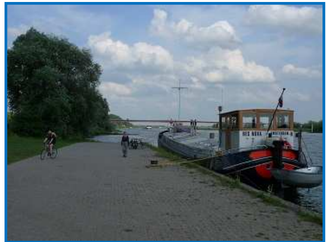
De Res Nova bij de brug in Rhenen in 2011