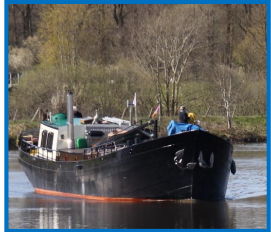
Ook hier op Vecht

De Ald Izer, is waarschijnlijk een Rosendaalse zeilklipper van oorsprong een vrachtschip.