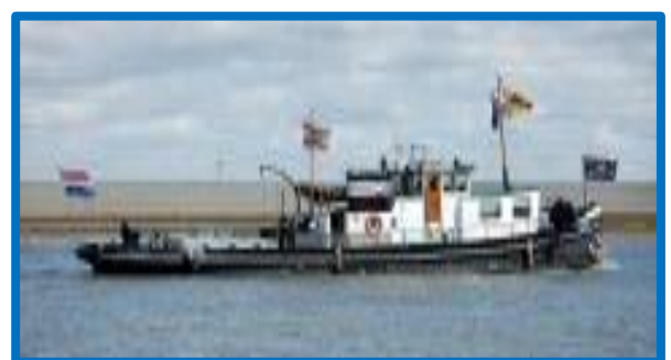
De Hannie onderweg naar Leer (D)

De huidige eigenaren kochten het schip in 2007 van deze familie en gebruikt de sleper voor bewoning en pleziervaart. Ze herdoopten haar tot "Hannie".