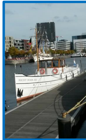
Recht door Zee nu