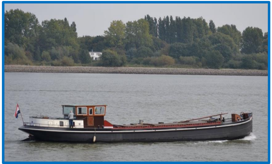
Rijnstroom VI heden