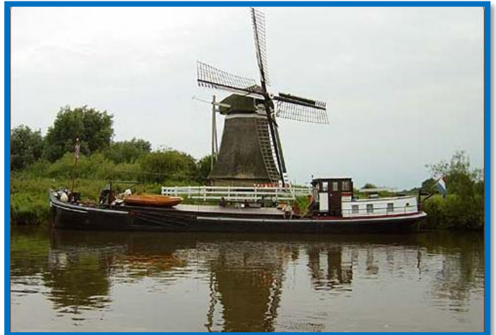
en het schip