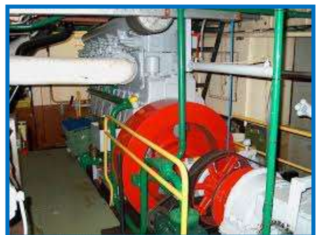
Een blik in de machinekamer

Velen zullen de boot nog kennen in het lichtblauw, naar het voorbeeld van de Betsie G van Van Doorn Sleepdiensten aan de Zaan. Later werd de hoofdkleur zwart, zoals de schepen van de walvissenbeschermers van Sea Shepherd.