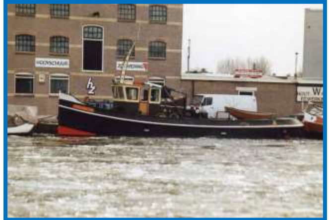
Als Anna Martha, met stuurhut uit de jaren '70

De Jessi is gebouwd als stoomsleper HENRI X voor F.A. van Duijnen Transport Maatschappij NV in Dordrecht. Later heeft deze als Luctor, Adrianus, Frans, Expres, Broedertrouw IX, Anna Martha II en Paul Watson gevaren. De huidige motor is een Worthington, een Amerikaanse motor die via het Marshall-plan in Nederland terecht is gekomen. Worthingtons zijn stationaire motoren, die gebruikt werden in gemalen of voor elektriciteitsopwekking. Hier betreft het de BB-uitvoering, 5 cilinders in lijn met een inhoud van 48 liter. Het afgegeven vermogen gaat via een Hallscott-keerkoppeling en een vertraging van 1:2 naar een schroefas met vierbladsschroef van \pm 1,20 m.